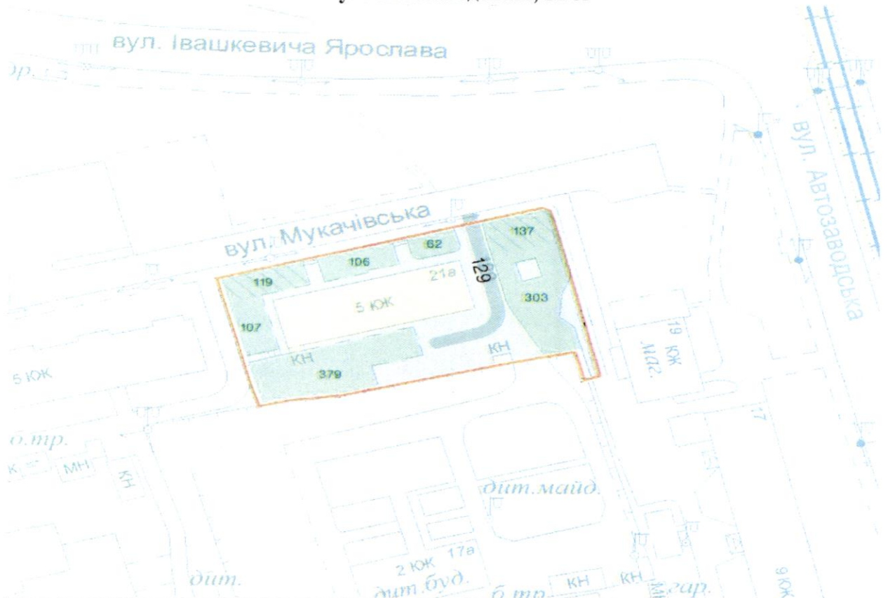
СХЕМА обслуговування території навколо багатоквартирного будинку на вул. Автозаводській, 21-А

Додаток 6 до Договору про надання послуги з управління багатоквартирним будинком від 07.02.2025 № 21