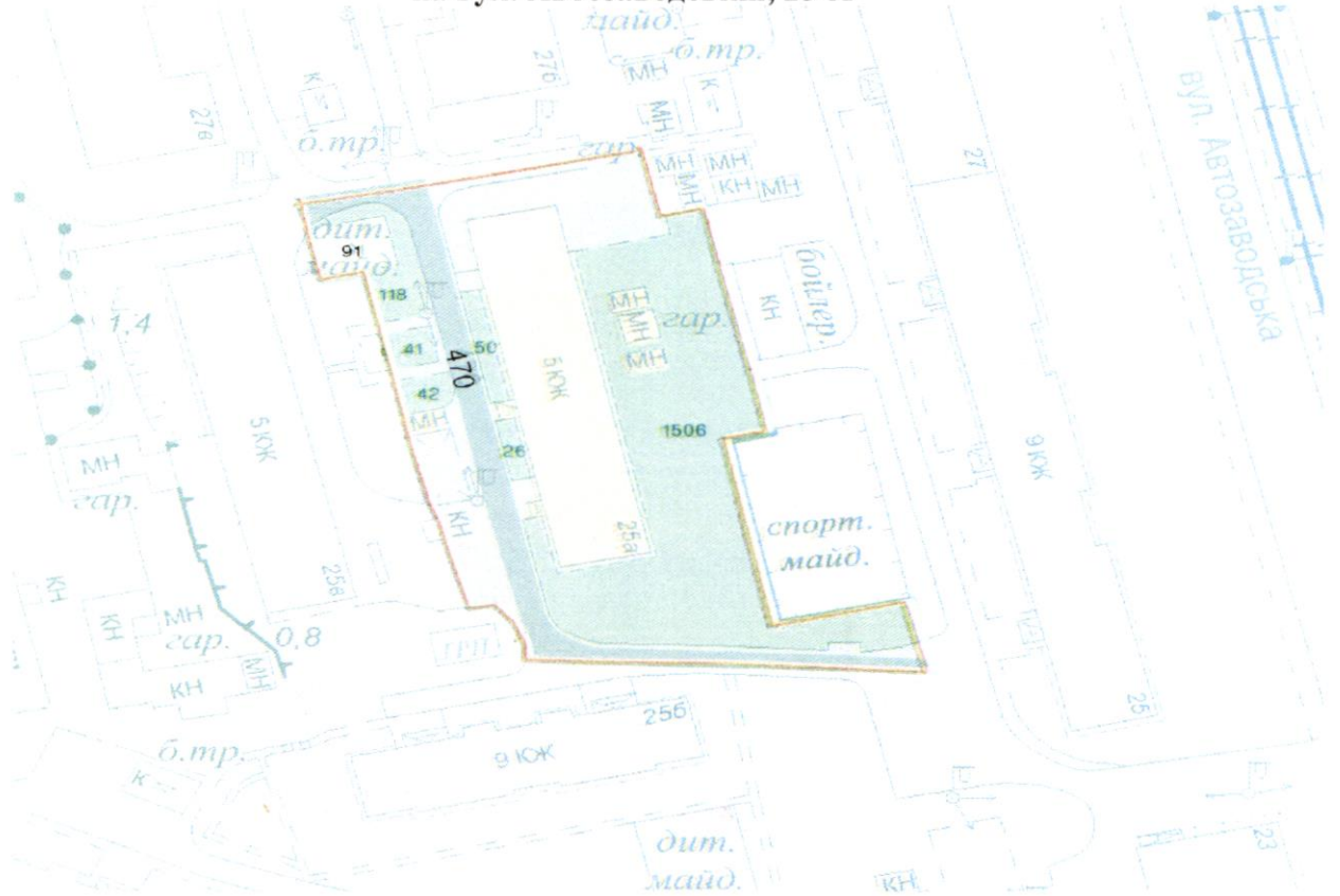
СХЕМА обслуговування території навколо багатоквартирного будинку на вул. Автозаводській, 25-А

Додаток 6 до Договору про надання послуги з управління багатоквартирним будинком від 04.02.2025 № 24