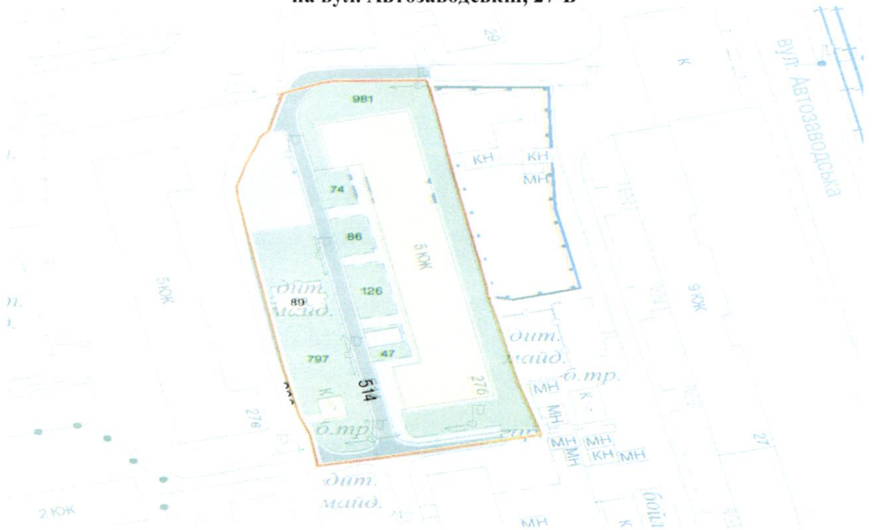
СХЕМА обслуговування території навколо багатоквартирного будинку на вул. Автозаводській, 27-Б

Додаток 6 до Договору про надання послуги з управління багатоквартирним будинком від 04.02.2025 № 26