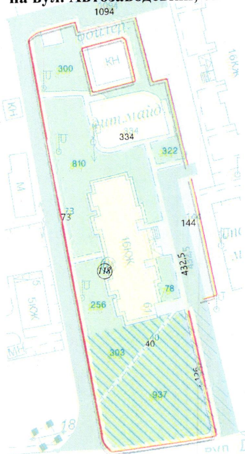
СХЕМА обслуговування території навколо багатоквартирного будинку на вул. Автозаводській, 61

Додаток 6 до Договору про надання послуги з управління багатоквартирним будинком від 07.02.2025 № 31