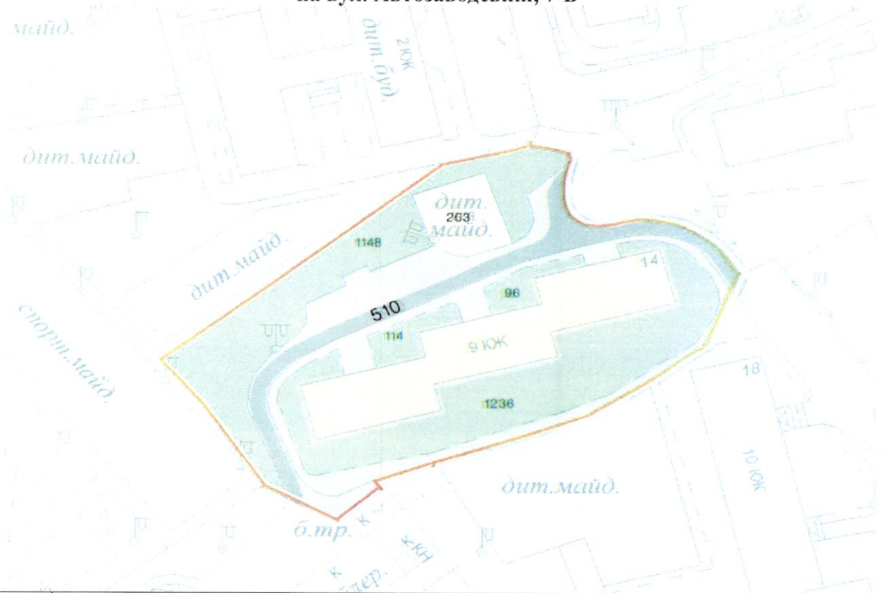
СХЕМА обслуговування території навколо багатоквартирного будинку на вул. Автозаводській, 7-Б

Додаток 6 до Договору про надання послуги з управління багатоквартирним будинком від 04.02.2025 № 14