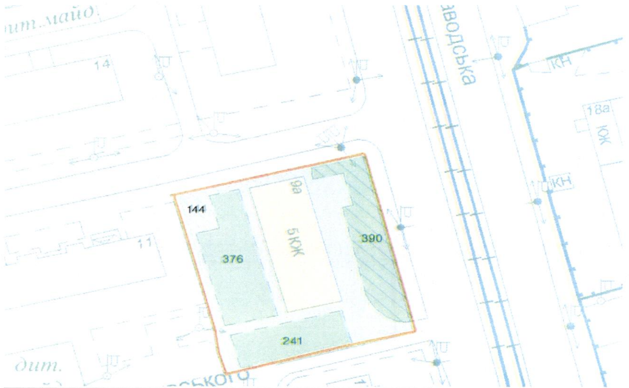
СХЕМА обслуговування території навколо багатоквартирного будинку на вул. Автозаводській, 9-А

Додаток 6 до Договору про надання послуги з управління багатоквартирним будинком від 04.02.2025 № 18