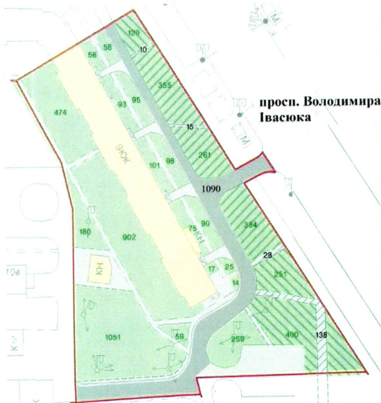
СХЕМА обслуговування території навколо багатоквартирного будинку вул. Олександра Архипенка, 12/3

Додаток 6 до Договору про надання послуги з управління багатоквартирним будинком від 07.02.2015 № 56