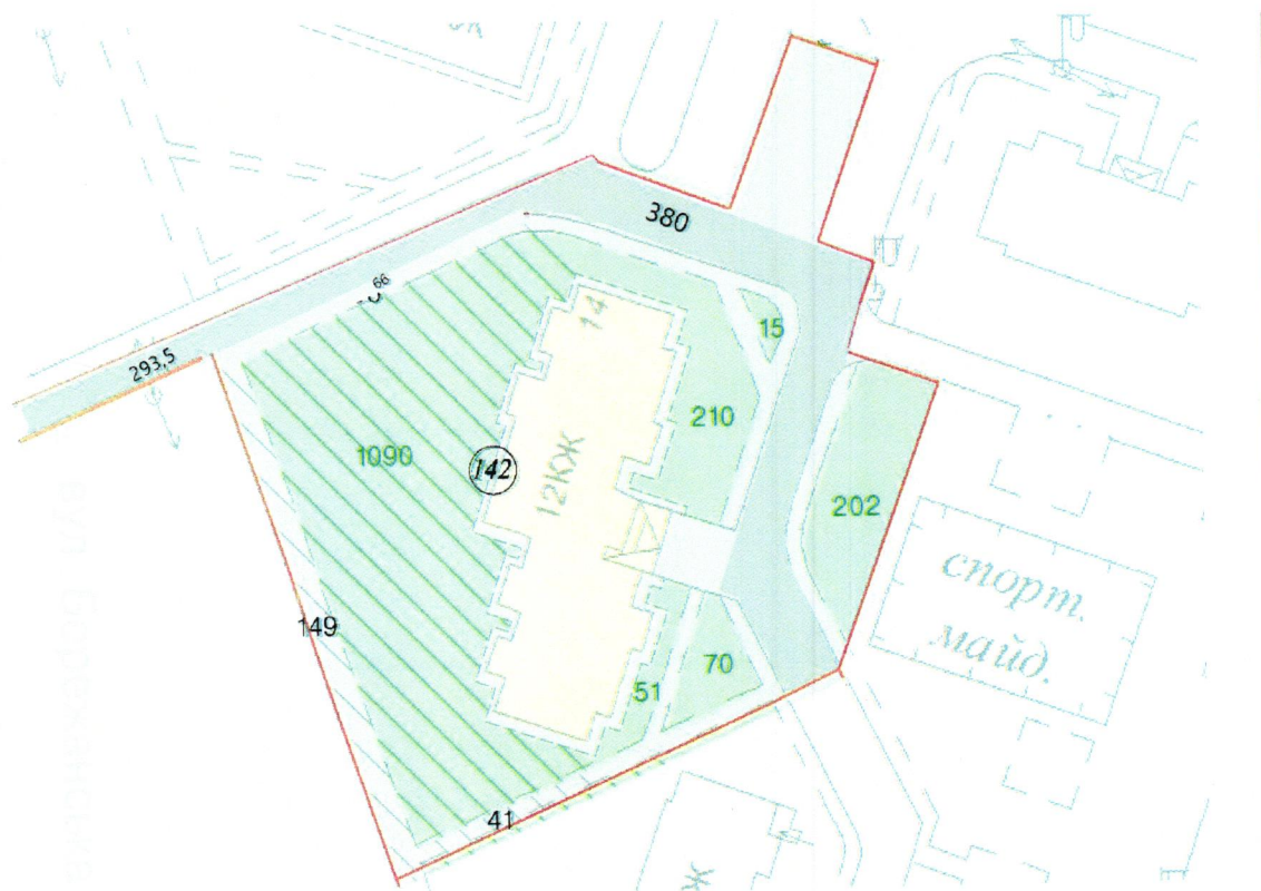
СХЕМА обслуговування території навколо багатоквартирного будинку на вул. Бережанській, 14

Додаток 6 до Договору про надання послуги з управління багатоквартирним будинком від 07.02.2025 № 59