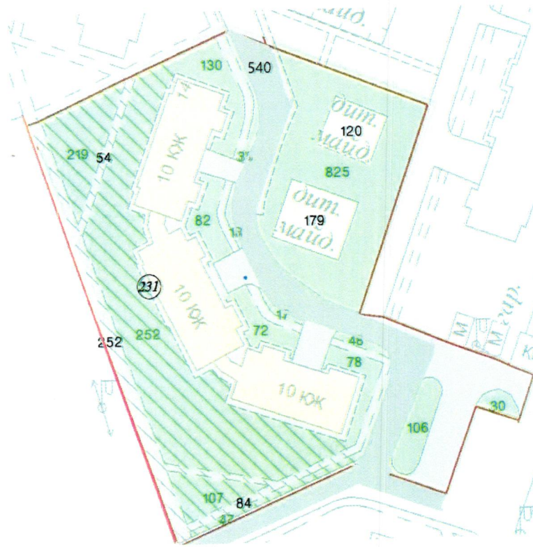
СХЕМА обслуговування території навколо багатоквартирного будинку на вул. Бережанській, 16

Додаток 6 до Договору про надання послуги з управління багатоквартирним будинком від 07.02.2025 № 60