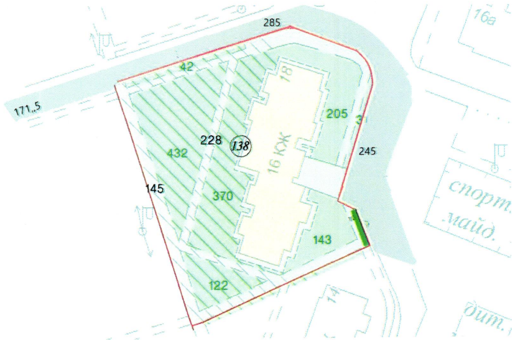
СХЕМА обслуговування території навколо багатоквартирного будинку на вул. Березанській, 18

Додаток 6 до Договору про надання послуги з управління багатоквартирним будинком від 07.02.2025 № 62