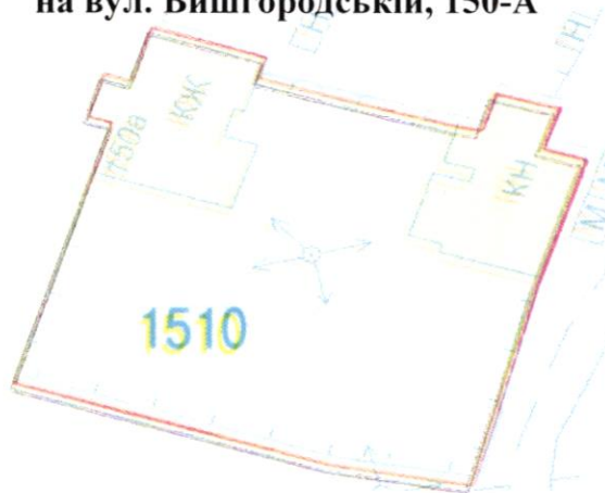
СХЕМА обслуговування території навколо багатоквартирного будинку на вул. Вишгородській, 150-А

Додаток 6 до Договору про надання послуги з управління багатоквартирним будинком від 07.07.2025 № 109