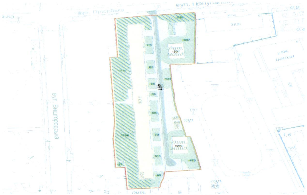
СХЕМА обслуговування території навколо багатоквартирного будинку на вул. Вишгородській, 32/2

Додаток 6 до Договору про надання послуги з управління багатоквартирним будинком від 07.08.2025 № 86