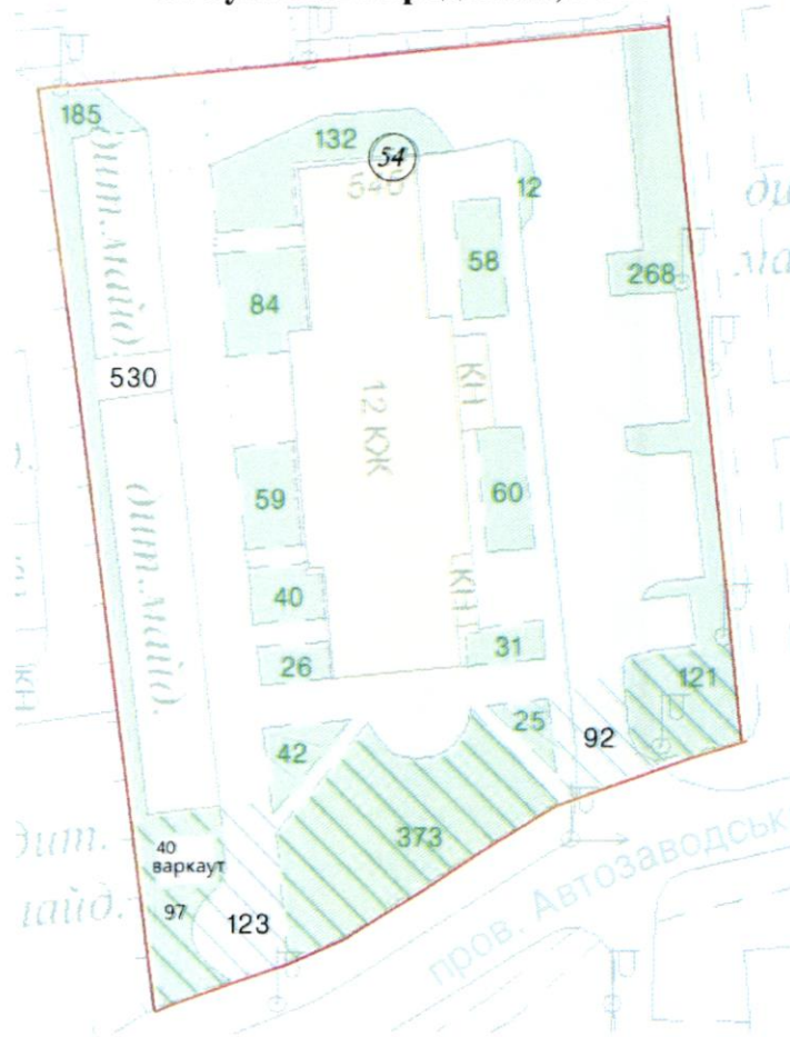
СХЕМА обслуговування території навколо багатоквартирного будинку на вул. Вишгородській, 54-Б

до Договору про надання послуги з управління багатоквартирним будинком від 07.02.2025 № 108