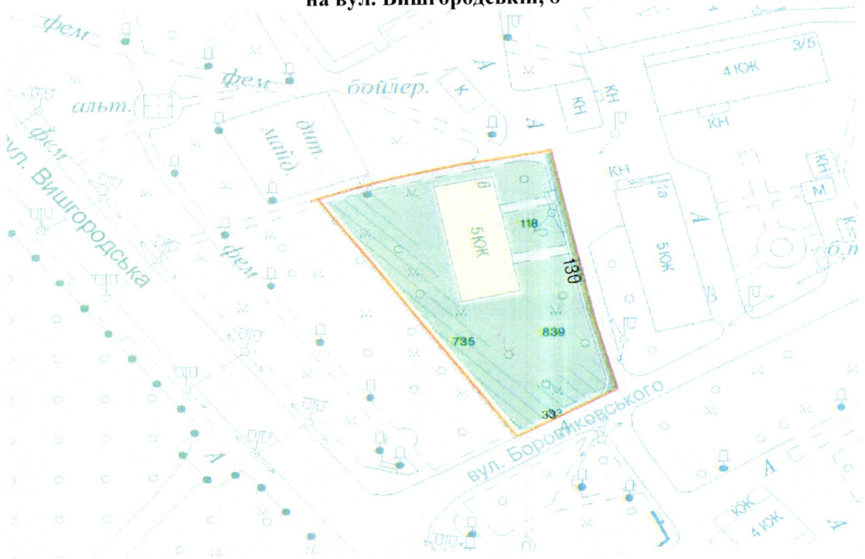
СХЕМА обслуговування території навколо багатоквартирного будинку на вул. Вишгородській, 8

Додаток 6 до Договору про надання послуги з управління багатоквартирним будинком від 07.08.2025 № 46