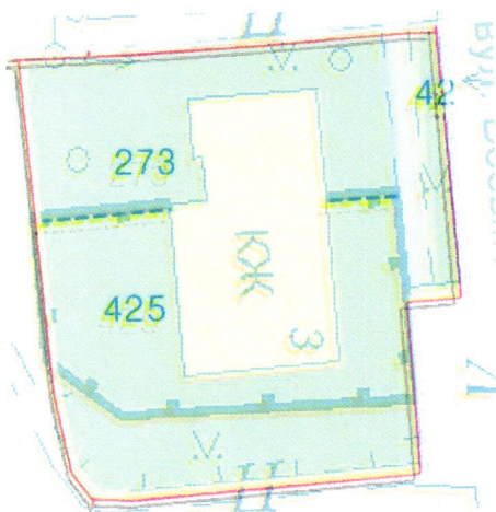
СХЕМА обслуговування території навколо багатоквартирного будинку на вул. Восьмого березня, 3

Додаток 6 до Договору про надання послуги з управління багатоквартирним будинком від 04.02.2025 № 172