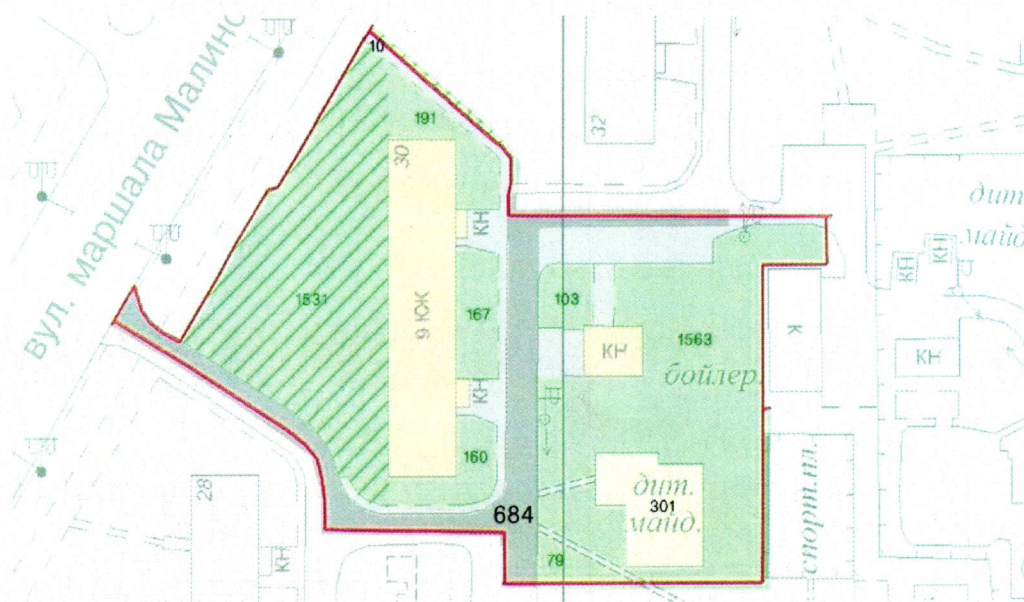
СХЕМА обслуговування території навколо багатоквартирного будинку на вул. Героїв полку «Азов», 30