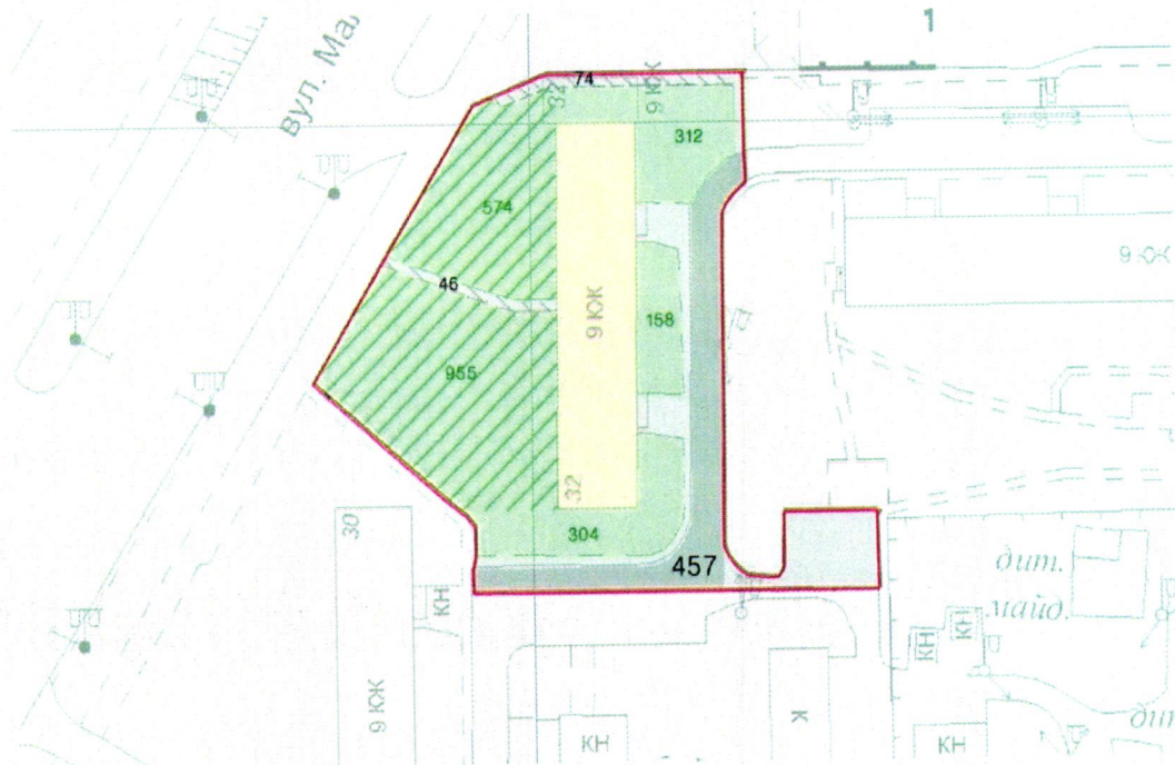
СХЕМА обслуговування території навколо багатоквартирного будинку на вул. Героїв полку «Азов», 32

Додаток 6 до Договору про надання послуги з управління багатоквартирним будинком від _____ № _____