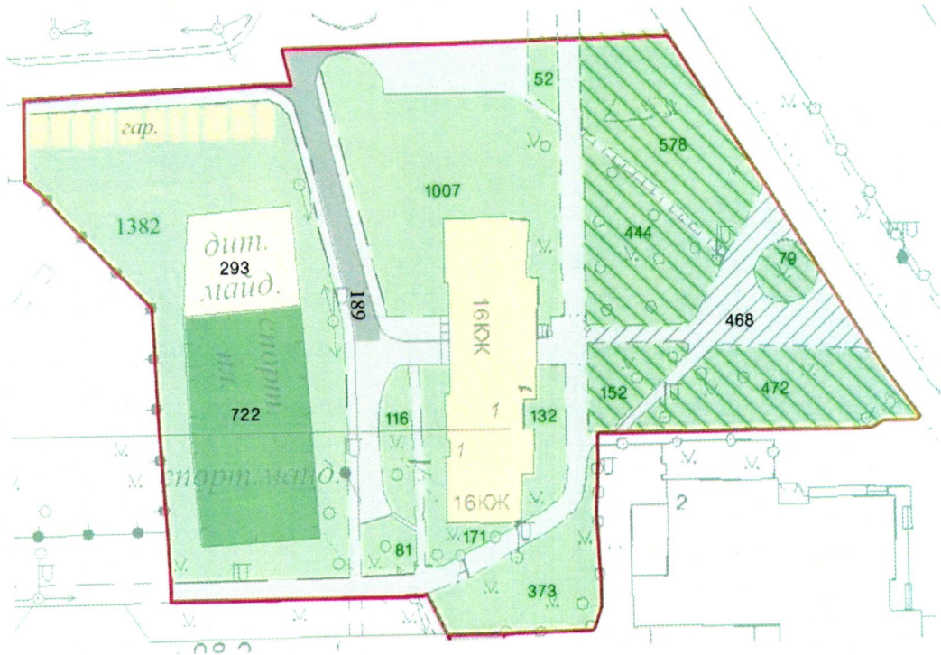
СХЕМА обслуговування території навколо багатоквартирного будинку на просп. Володимира Івасюка, 1

Додаток 6 до Договору про надання послуги з управління багатоквартирним будинком від 07.02.2025 № 110