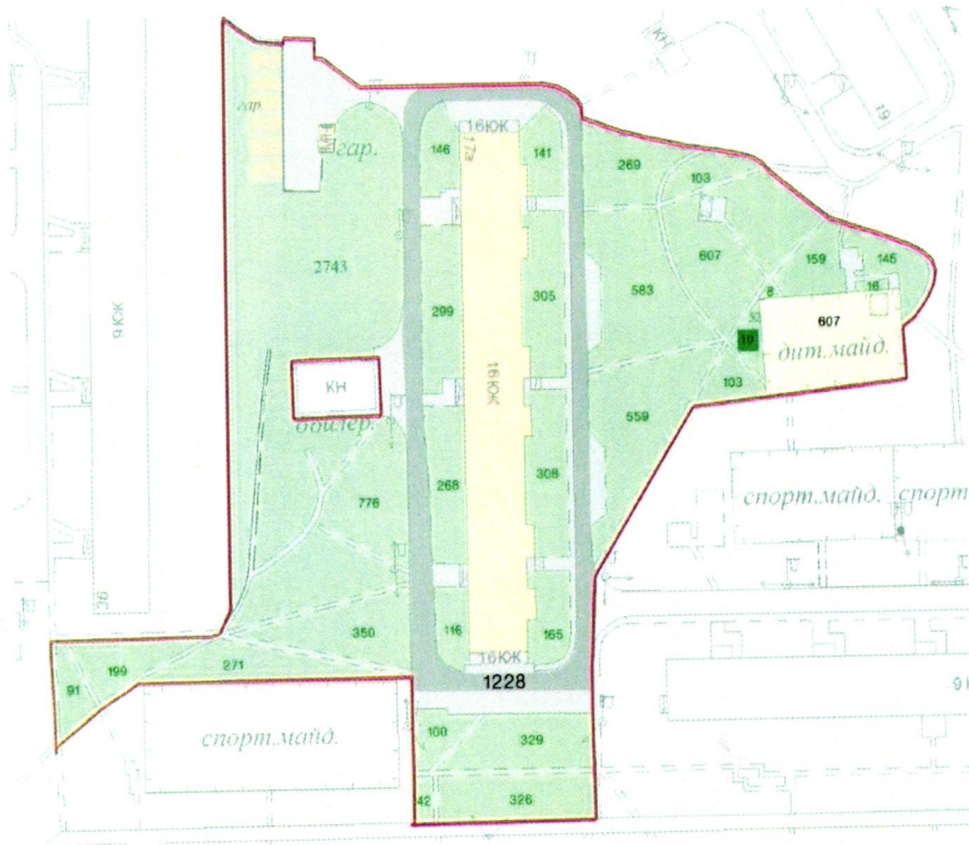
СХЕМА обслуговування території навколо багатоквартирного будинку на просп. Володимира Івасюка, 17-А

Додаток 6 до Договору про надання послуги з управління багатоквартирним будинком від 07.01.2025 № 127