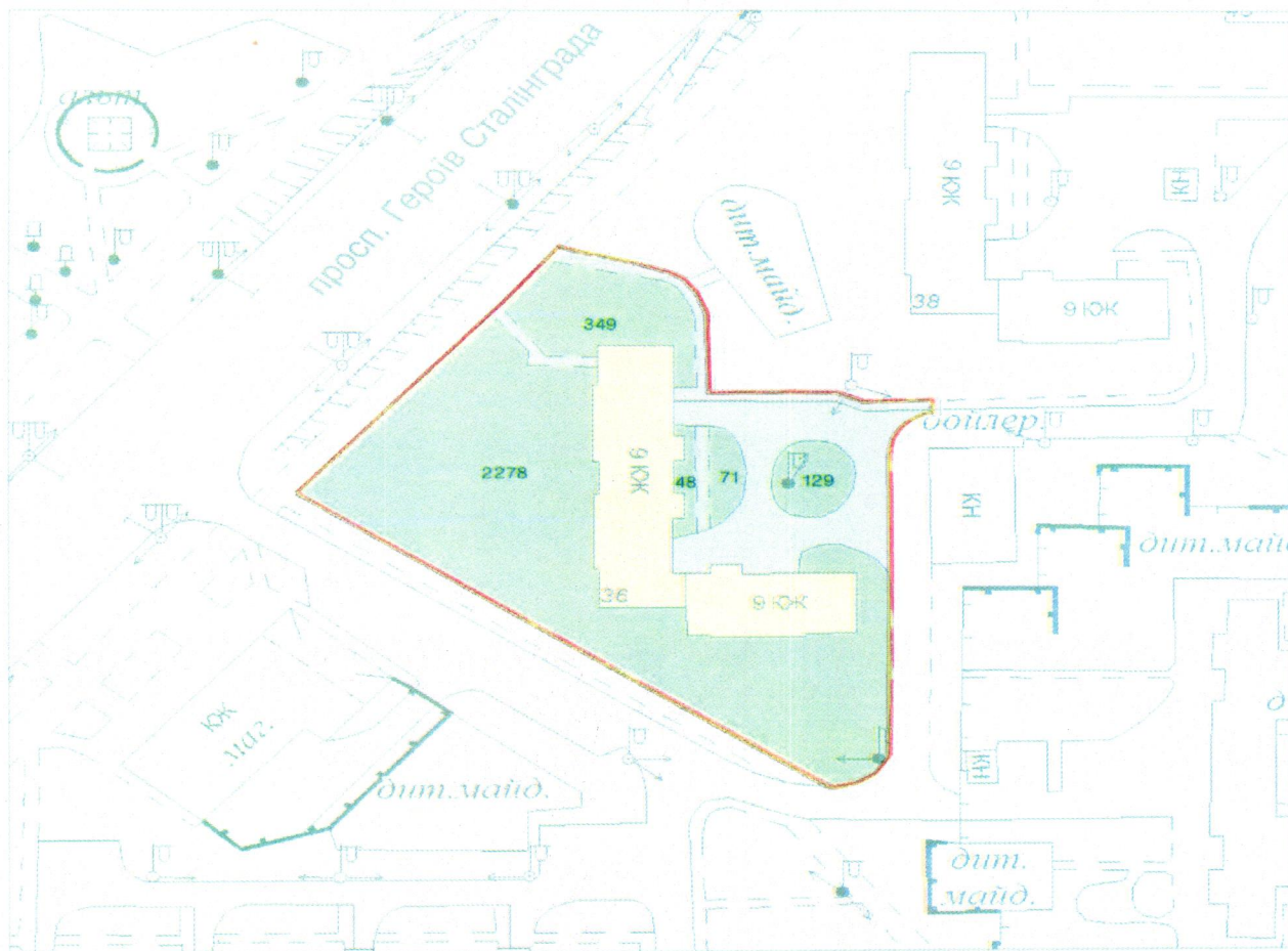
СХЕМА обслуговування території навколо багатоквартирного будинку на просп. Володимира Івасюка, 36

Додаток 6 до Договору про надання послуги з управління багатоквартирним будинком від 07.02.2025 № 141