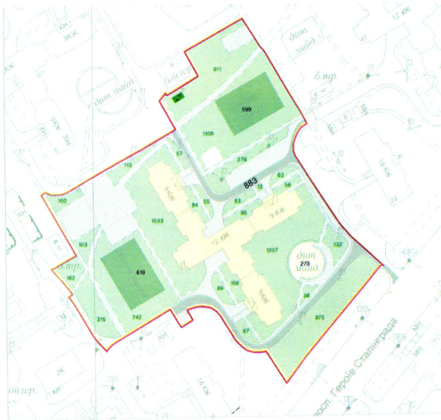
СХЕМА обслуговування території навколо багатоквартирного будинку на просп. Володимира Івасюка, 37