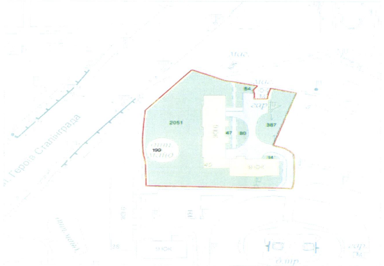
СХЕМА обслуговування території навколо багатоквартирного будинку на просп. Володимира Івасюка, 40

Додаток 6 до Договору про надання послуги з управління багатоквартирним будинком від 07.02.2015 № 146