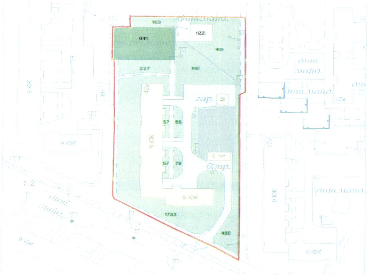
СХЕМА обслуговування території навколо багатоквартирного будинку на просп. Володимира Івасюка, 42-А