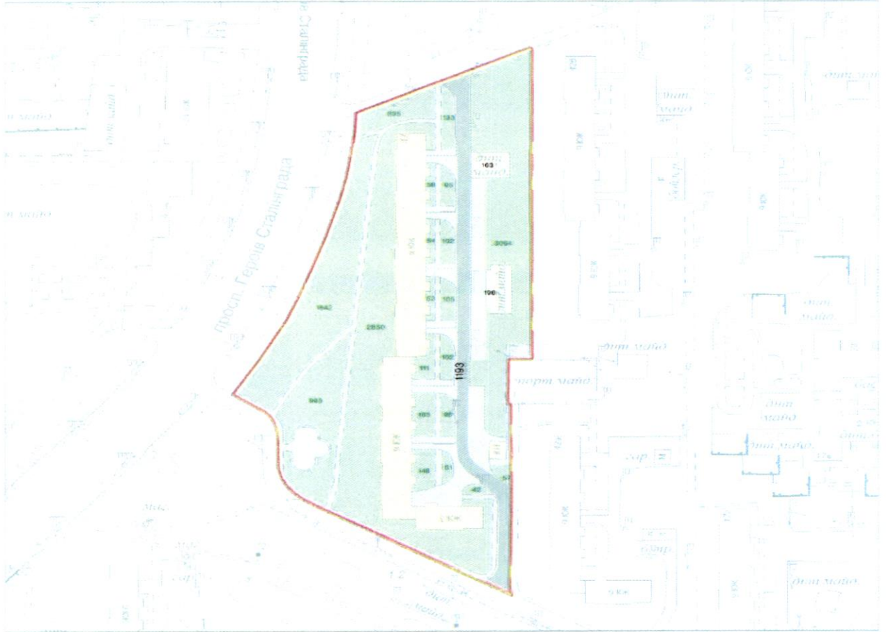
СХЕМА обслуговування території навколо багатоквартирного будинку на просп. Володимира Івасюка, 42

Додаток 6 до Договору про надання послуги з управління багатоквартирним будинком від 07.02.2025 № 148