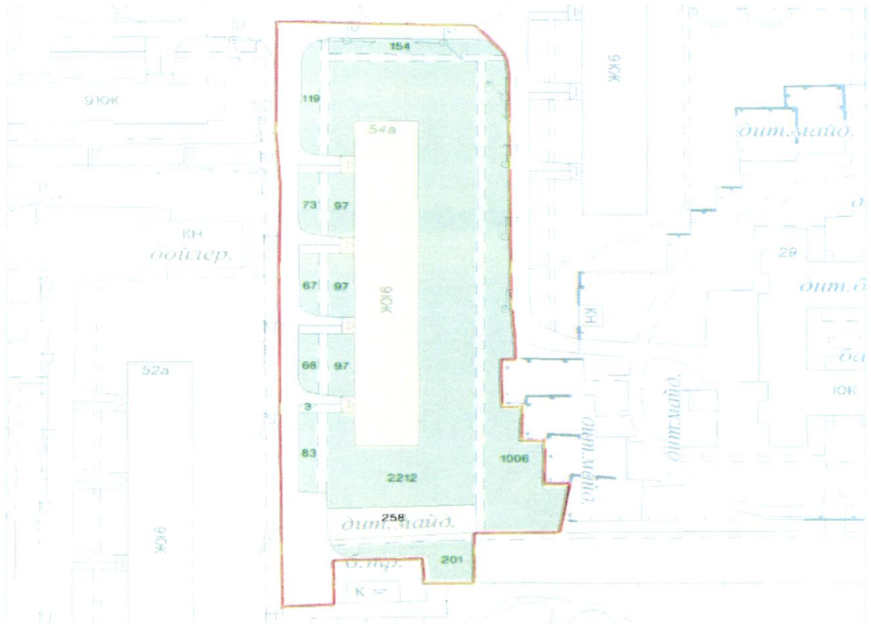
СХЕМА обслуговування території навколо багатоквартирного будинку на просп. Володимира Івасюка, 54-А

Додаток 6 до Договору про надання послуги з управління багатоквартирним будинком від 07.02.2025 № 163