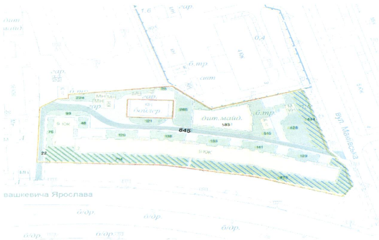
СХЕМА обслуговування території навколо багатоквартирного будинку на вул. Ярослава Івашкевича, 3

Додаток 6 до Договору про надання послуги з управління багатоквартирним будинком від 09.08.2023 № 1