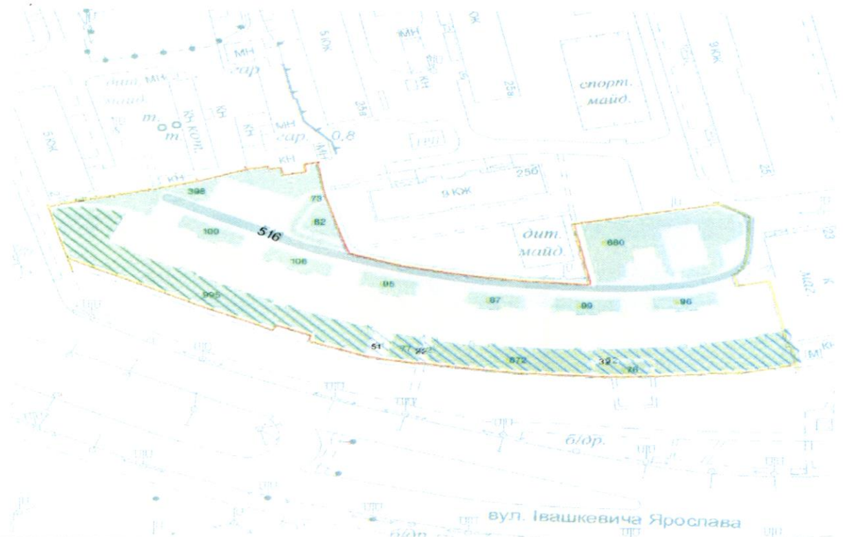
СХЕМА обслуговування території навколо багатоквартирного будинку на вул. Ярослава Івашкевича, 5

Додаток 6 до Договору про надання послуги з управління багатоквартирним будинком від 04.02.2025 № 3