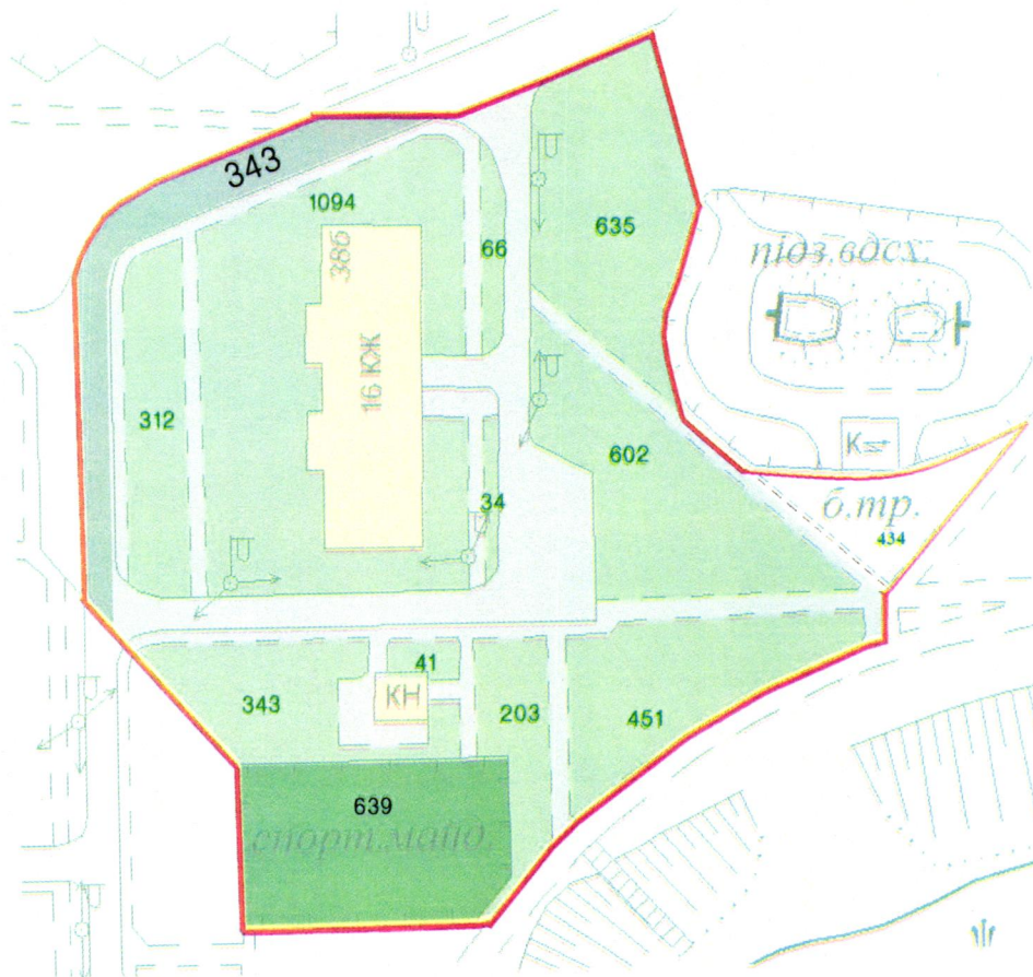
СХЕМА обслуговування території навколо багатоквартирного будинку на вул. Героїв Дніпра, 38-Б

Додаток 6 до Договору про надання послуги з управління багатоквартирним будинком від 07.02.2025 № 222