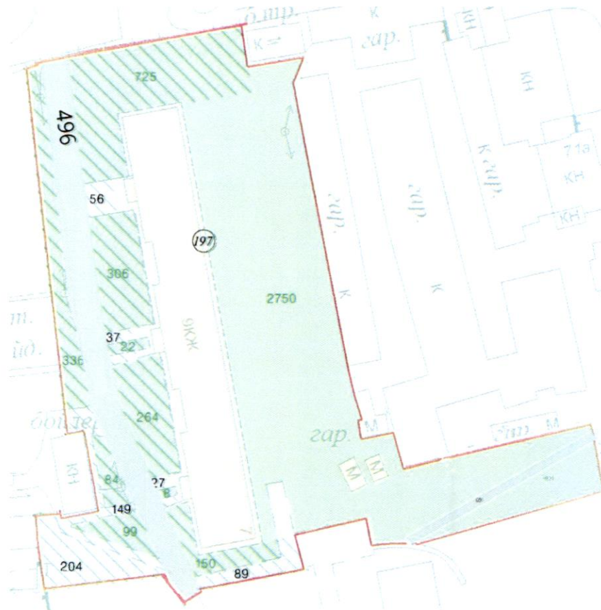
СХЕМА обслуговування території навколо багатоквартирного будинку на вул. Дубровицькій, 7

Додаток 6 до Договору про надання послуги з управління багатоквартирним будинком від 07.08.2025 № 285