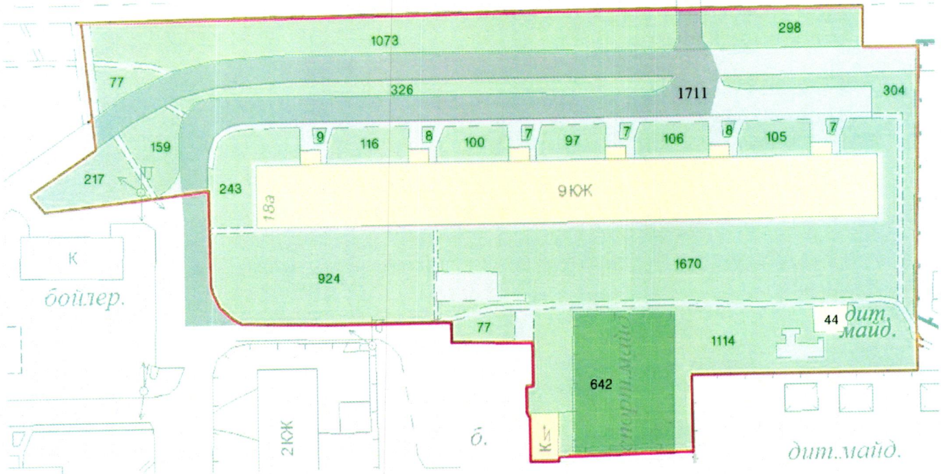
СХЕМА обслуговування території навколо багатоквартирного будинку на вул. Йорданській, 18-А

Додаток 6 до Договору про надання послуги з управління багатоквартирним будинком від 07.02.2025 № 305