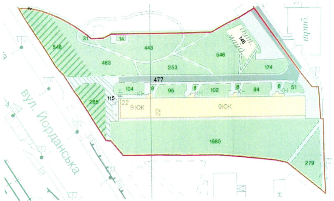
СХЕМА обслуговування території навколо багатоквартирного будинку на вул. Йорданській, 22

Додаток 6 до Договору про надання послуги з управління багатоквартирним будинком від 07.07.2025 № 307