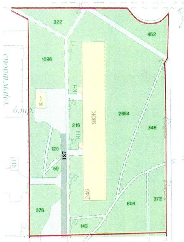
СХЕМА обслуговування території навколо багатоквартирного будинку на вул. Йорданській, 24-Б

Додаток 6 до Договору про надання послуги з управління багатоквартирним будинком від 07.02.2025 № 309