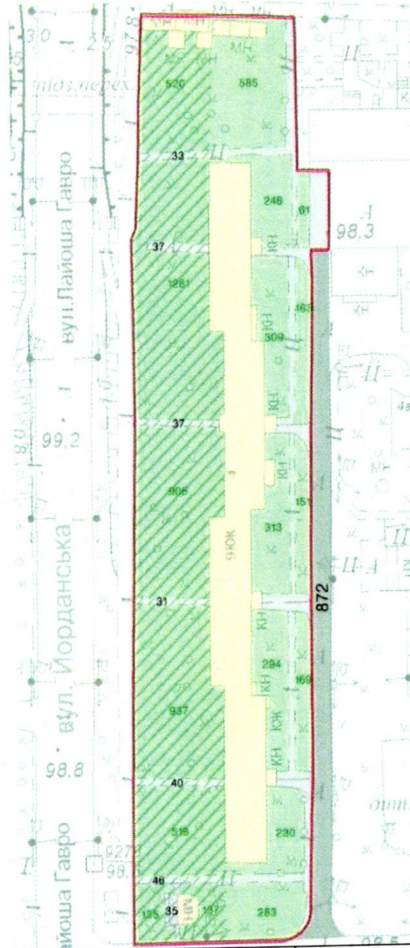
СХЕМА обслуговування території навколо багатоквартирного будинку на вул. Йорданській, 4

Додаток 6 до Договору про надання послуги з управління багатоквартирним будинком від 07.12.2025 № 292