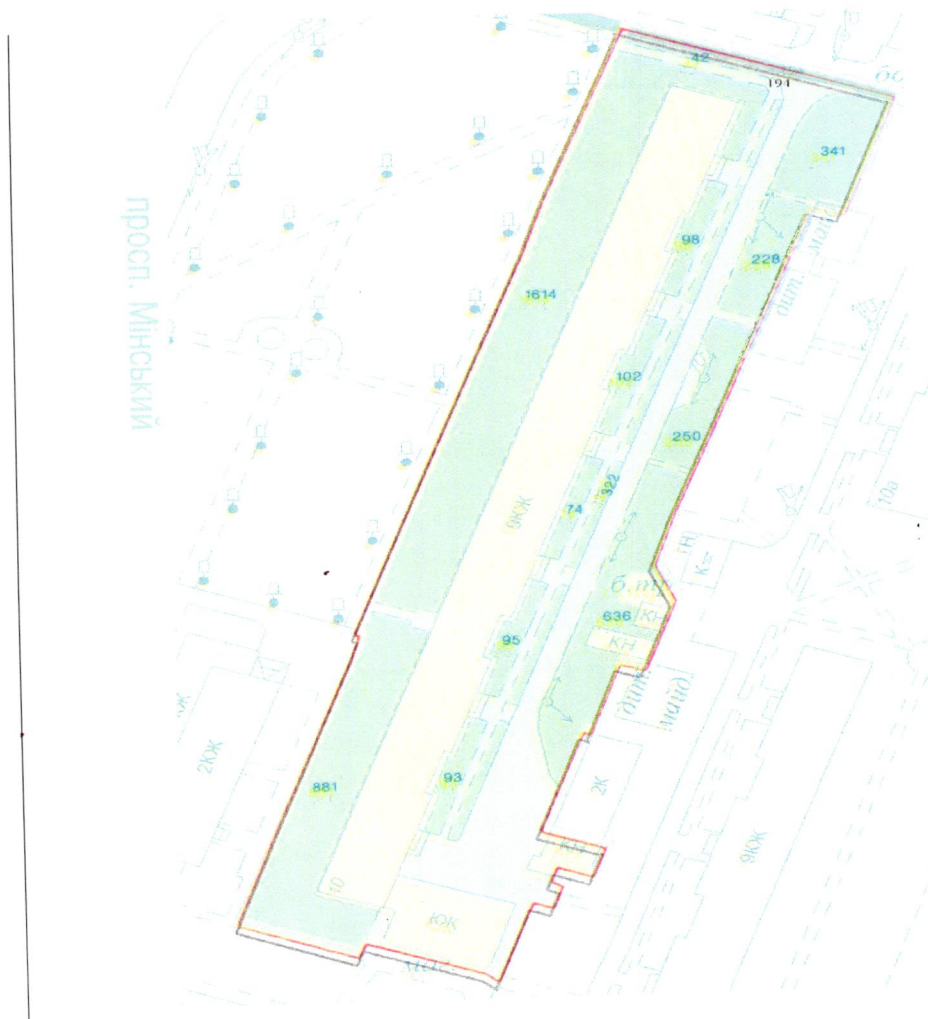
СХЕМА обслуговування території навколо багатоквартирного будинку на просп. Литовському, 10

Додаток 6 до Договору про надання послуги з управління багатоквартирним будинком від 07.08.2025 № 382