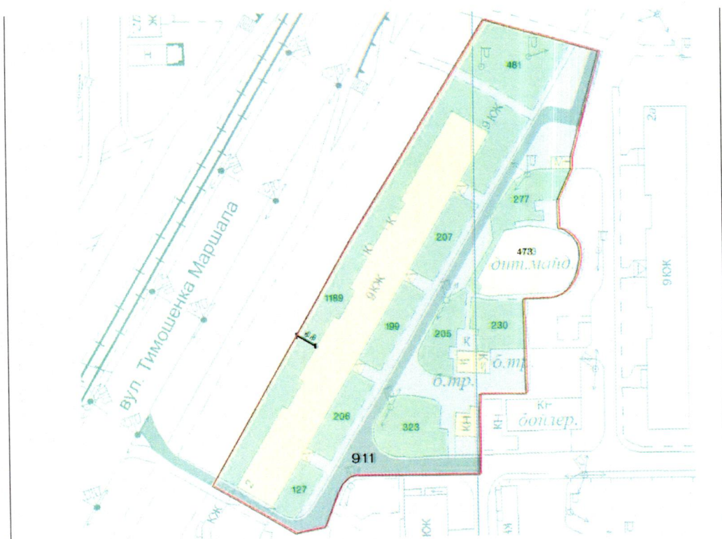
СХЕМА обслуговування території навколо багатоквартирного будинку на вул. Левка Лук'яненка, 2

Додаток 6 до Договору про надання послуги з управління багатоквартирним будинком від 07.02.2025 № 357