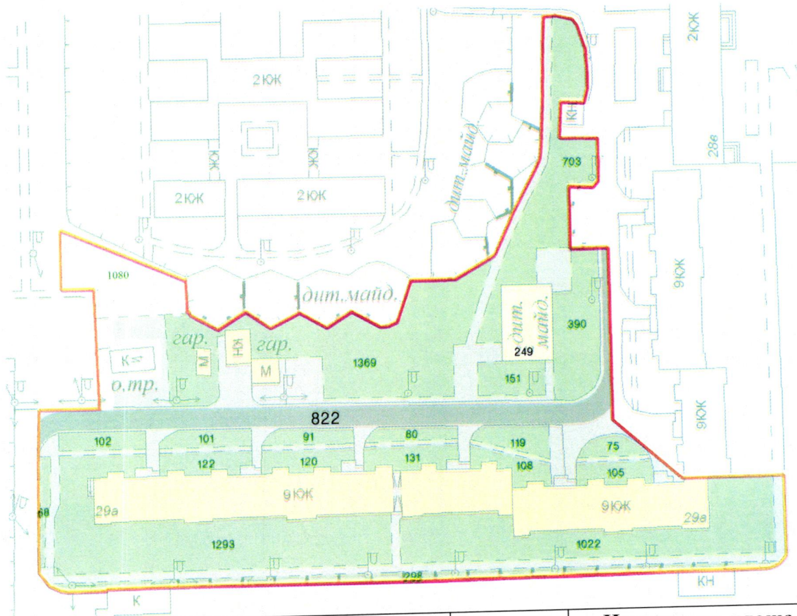
СХЕМА обслуговування території навколо багатоквартирного будинку на вул. Левка Лук'яненка, 29-А

Додаток 6 до Договору про надання послуги з управління багатоквартирним будинком від 07.02.2025 № 378