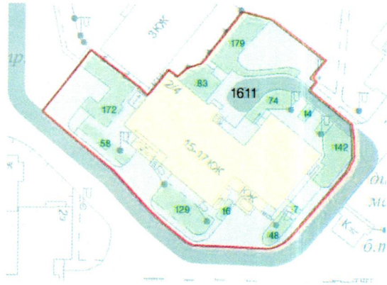
СХЕМА обслуговування території навколо багатоквартирного будинку на вул. Левка Лук'яненка, 2/4

Додаток 6 до Договору про надання послуги з управління багатоквартирним будинком від 07.02.2025 № 355