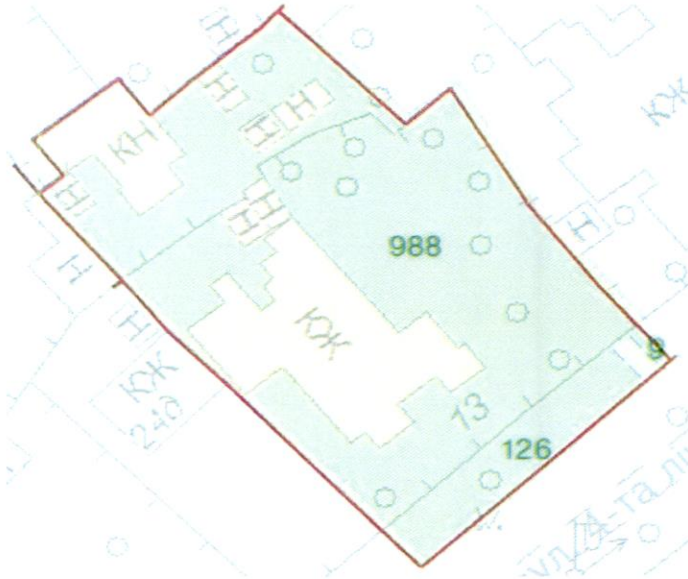
СХЕМА обслуговування території навколо багатоквартирного будинку на вул. Ліній, 13-Б

Додаток 6 до Договору про надання послуги з управління багатоквартирним будинком від 07.02.2025 № 345