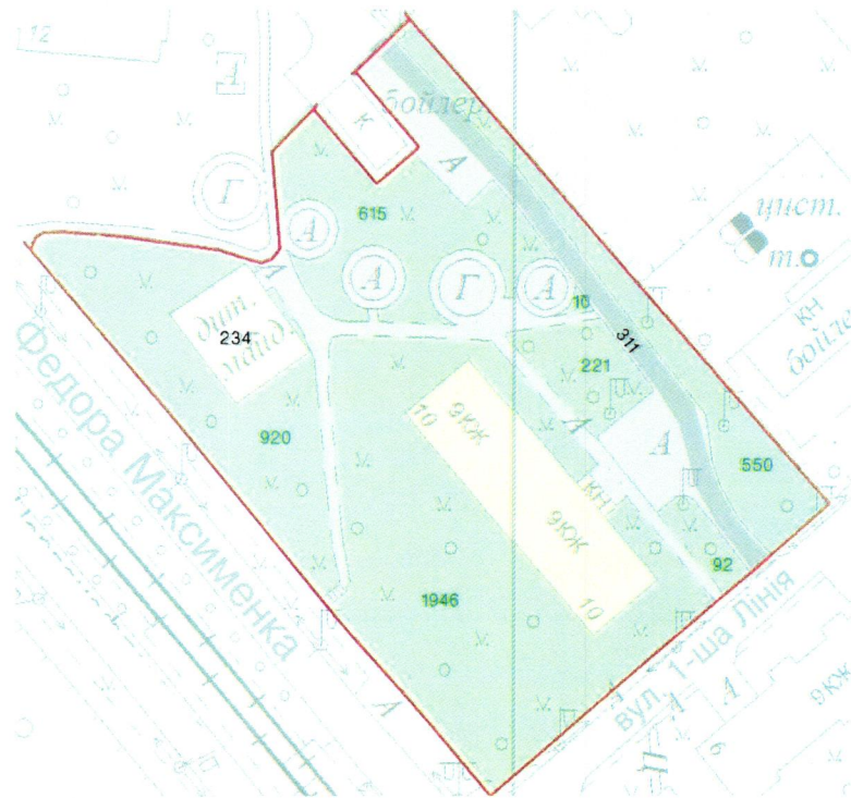
СХЕМА обслуговування території навколо багатоквартирного будинку на вул. Федора Максименка, 10

Додаток 6 до Договору про надання послуги з управління багатоквартирним будинком від 04.02.2025 № 394