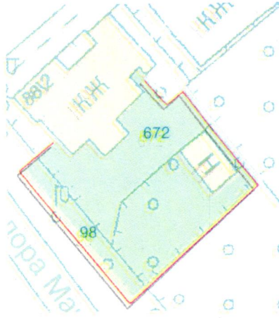
СХЕМА обслуговування території навколо багатоквартирного будинку на вул. Федора Максименка, 88/2

Додаток 6 до Договору про надання послуги з управління багатоквартирним будинком від 08.02.2025 № 404