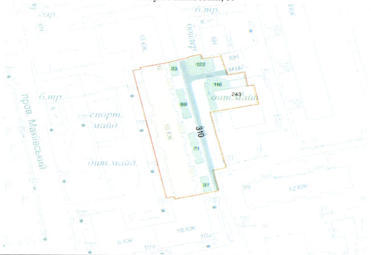
СХЕМА обслуговування території навколо багатоквартирного будинку на вул. Макіївській, 10

Додаток 6 до Договору про надання послуги з управління багатоквартирним будинком від 07.02.2023 № 390