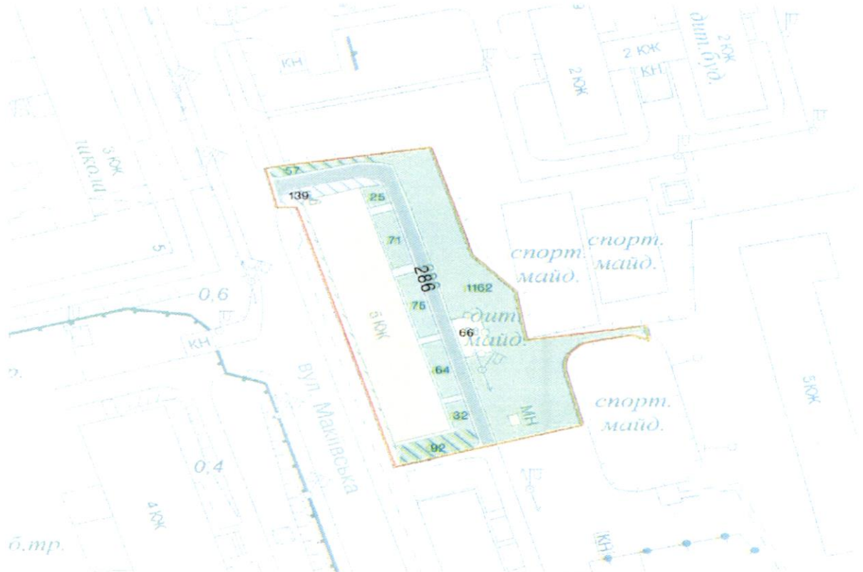
СХЕМА обслуговування території навколо багатоквартирного будинку на вул. Макіївській, 6

Додаток 6 до Договору про надання послуги з управління багатоквартирним будинком від 08.02.2025 № 388