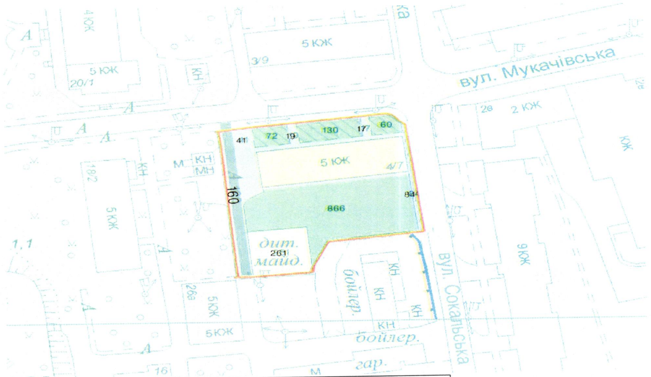
СХЕМА обслуговування території навколо багатоквартирного будинку на вул. Мукачівській, 4/7

Додаток 6 до Договору про надання послуги з управління багатоквартирним будинком від 07.02.2025 № 406