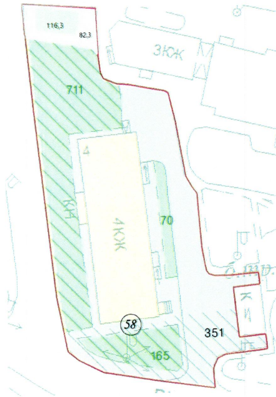
СХЕМА обслуговування території навколо багатоквартирного будинку на вул. Академіка Навашина, 4

Додаток 6 до Договору про надання послуги з управління багатоквартирним будинком від 08.02.2025 № 412