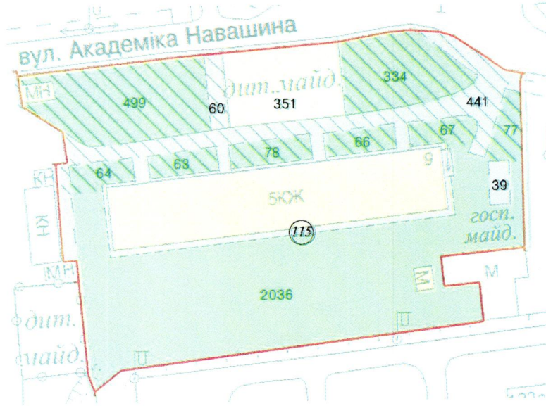
СХЕМА обслуговування території навколо багатоквартирного будинку на вул. Академіка Навашина, 9

Додаток 6 до Договору про надання послуги з управління багатоквартирним будинком від 02.02.2025 № 413