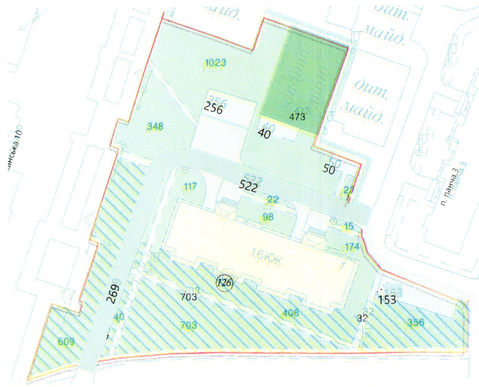
СХЕМА обслуговування території навколо багатоквартирного будинку на вул. Петра Панча, 1

Додаток 6 до Договору про надання послуги з управління багатоквартирним будинком від 07.02.2015 № 513