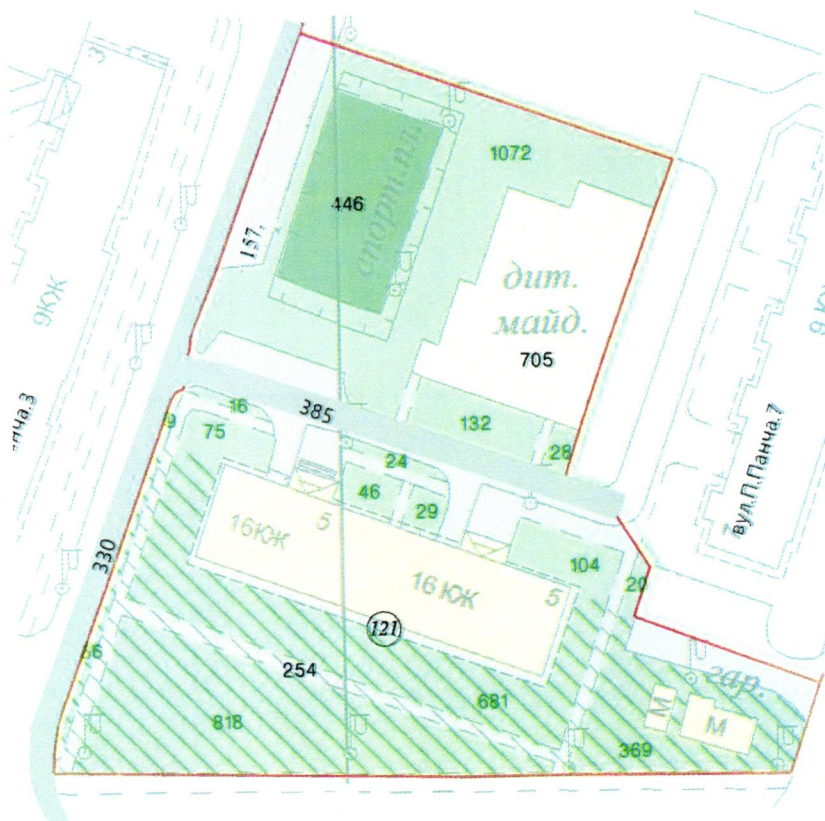
СХЕМА обслуговування території навколо багатоквартирного будинку на вул. Петра Панча, 5

Додаток 6 до Договору про надання послуги з управління багатоквартирним будинком від 07.02.2025 № 516