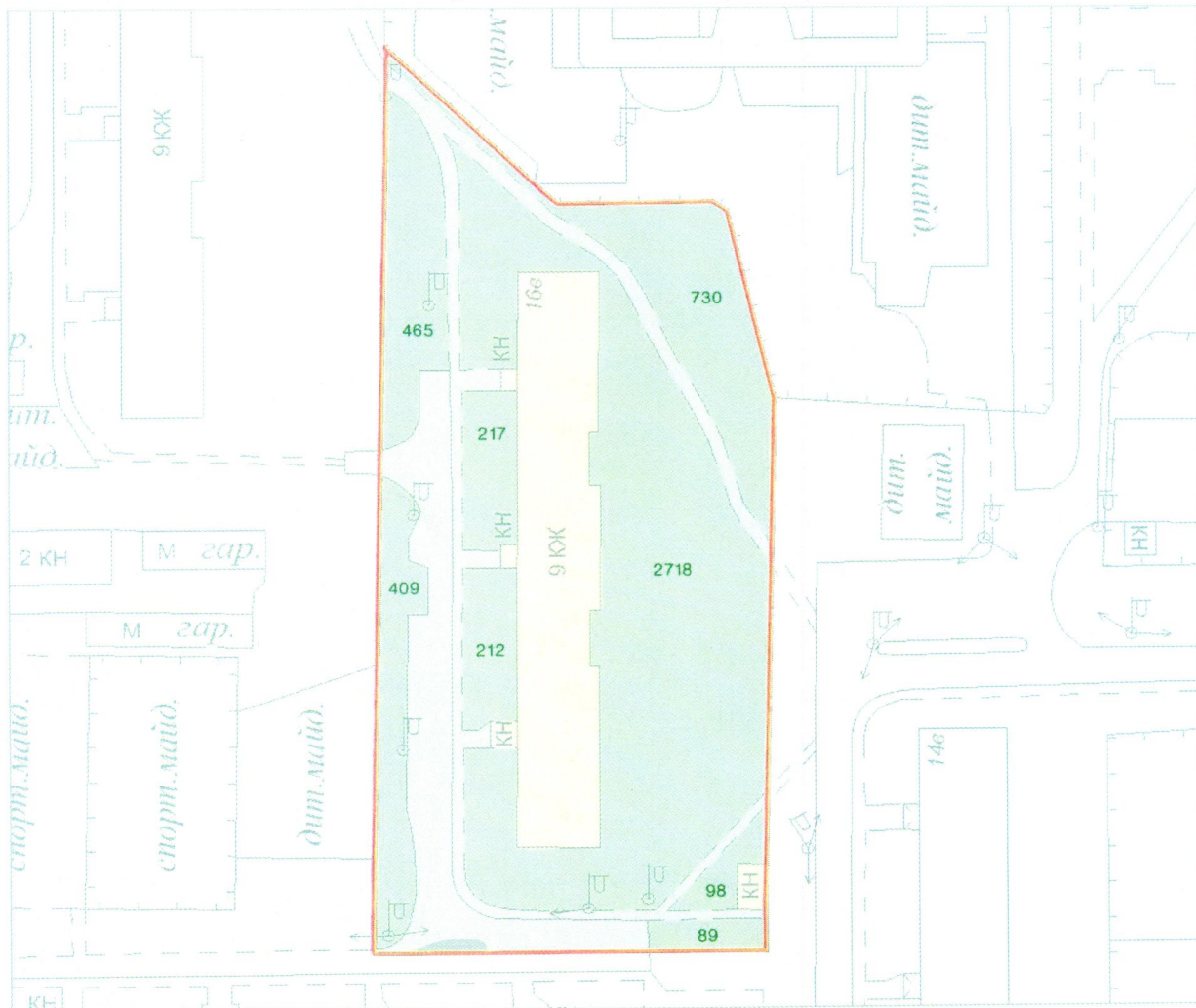
СХЕМА обслуговування території навколо багатоквартирного будинку на просп. Оболонському, 16-В

Додаток 6 до Договору про надання послуги з управління багатоквартирним будинком від 07.02.2025 № 446