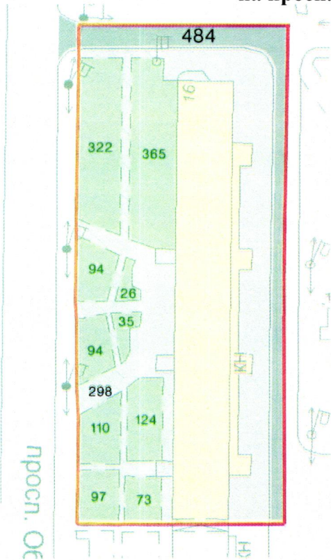
СХЕМА обслуговування території навколо багатоквартирного будинку на просп. Оболонському, 16 (9-12 під.)

Додаток 6 до Договору про надання послуги з управління багатоквартирним будинком від 07.02.2025 № 443