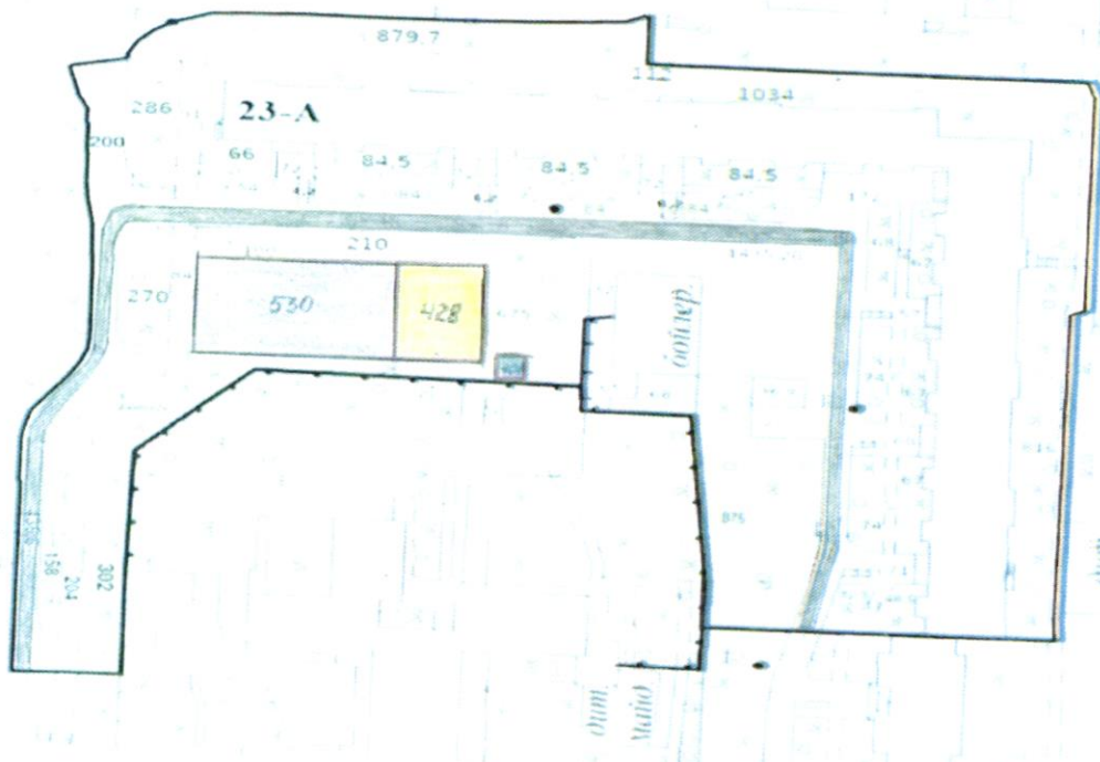
СХЕМА обслуговування території навколо багатоквартирного будинку на просп. Оболонському, 23-А

Додаток 6 до Договору про надання послуги з управління багатоквартирним будинком від 07.08.2025 № 454